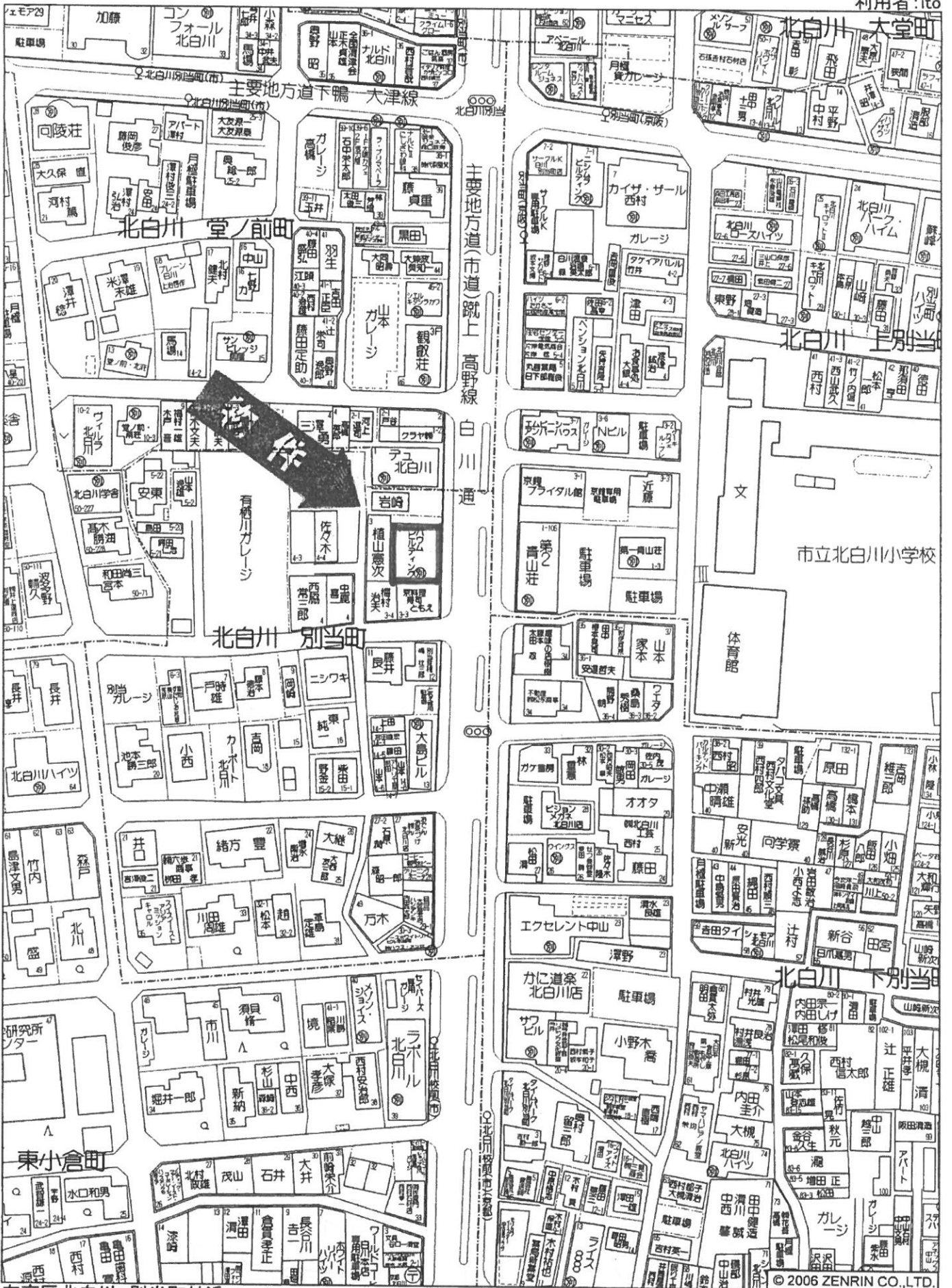
左京区北白川 別当町付近